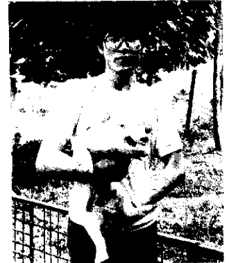
封面：養豬人家

HARVEST Farm Magazine P.O.BOX 29 Taipei, Taiwan Republic of China