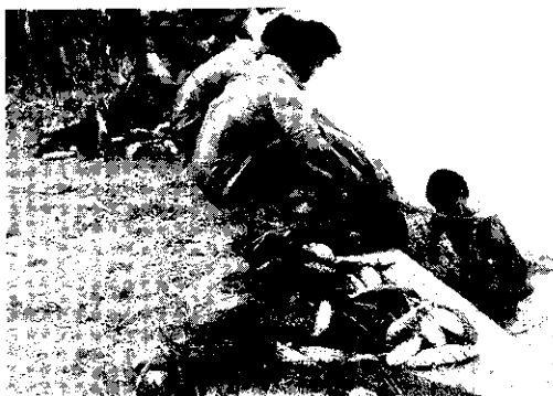
金門的虱目魚無法越冬，在冬季來臨前須先捕撈出售。