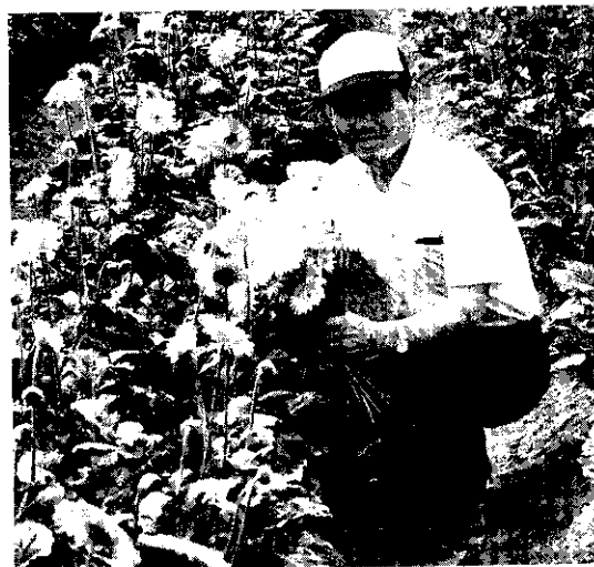
花卉栽培有3種訓練班