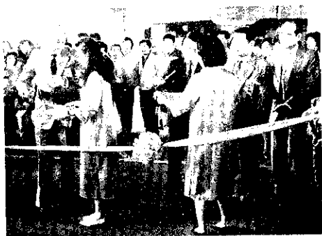
↑ 北縣假日花市剪綵開幕