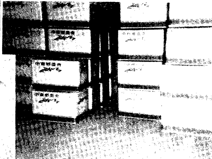
每箱為20公斤包裝，並自去年12月起，加貼青果共同運銷標