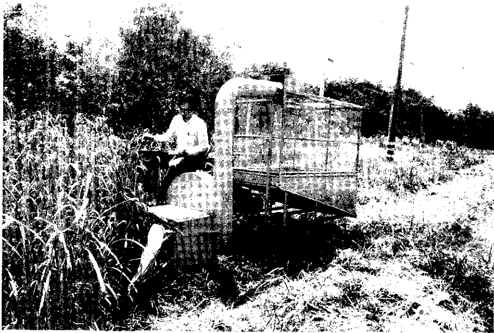
第一階段研製完成之狼尾草青割收穫機田間試驗情形

目前本省酪農約有1,100戶，狼尾草種植面積2,000公頃左右，一般以人工割取捆紮運回牧場，再以切草機切成小段，加配少許精料餵飼，也有以背負式割草機先行割取，再運回牧場切碎餵飼；本省所產奶量，僅佔需求量的10%，其餘均仰賴進口，而近年來，由於國民生活水準之提高，對奶品之消費量也不斷增加，酪農事業因此極具發展潛力。