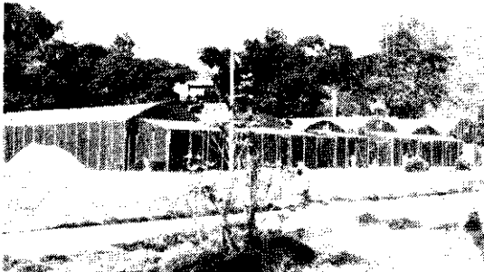
(台灣省農業試驗所菇類研究所)