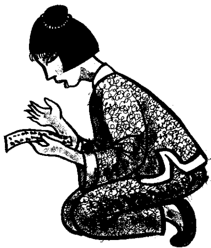
倏地，從神座上飄下一張字箋。施素娟揀起字箋一瞧……