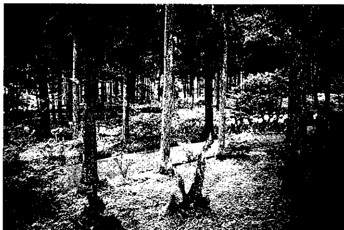
森林是最好的戶外活動場所(溪頭森林遊樂區)

地球是目前宇宙中已知唯一具有生命的星球，因地球具有維生所需的資源，人類存在自然環境中，是依賴地球上所具有的自然資源，人類要維持生存，就必須利用這些資源，此一概念可以說是以人為中心。不幸的是此一觀點在工業革命之後被大大鼓吹，所謂消費時代的來臨，加以工業發展帶來了嚴重的污染，使得人類由順應自然生存的角色，變成破壞、征服自然的侵略者。1960年以後，一連串產生了能源、食物、水以及其他資源匱乏的危機，使得生態學者憂心如焚，於是提出了自然保育的理念。