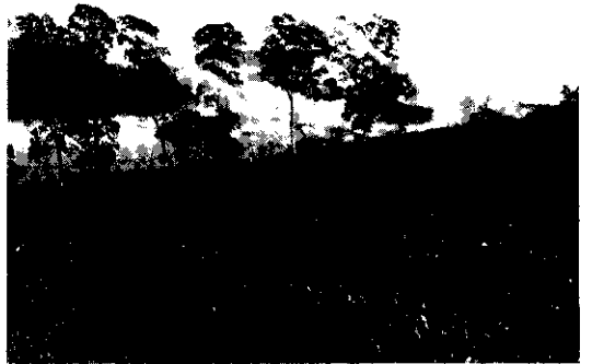
茶園利用噴灌設施灌溉

④採集病葉集中燒毀，如發生嚴重時，以後有可能逐漸引起枯枝，為減少茶樹內部濕度，可實施中剪枝或深剪枝，以提高其通氣性，並將剪除枝條，及掛在樹幹病葉等集中燒毀，可減少感染源。