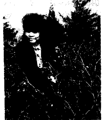
封面：豌豆新品種台中12號

HARVEST Farm Magazine P.O. BOX 29 Taipei, Taiwan Republic of China