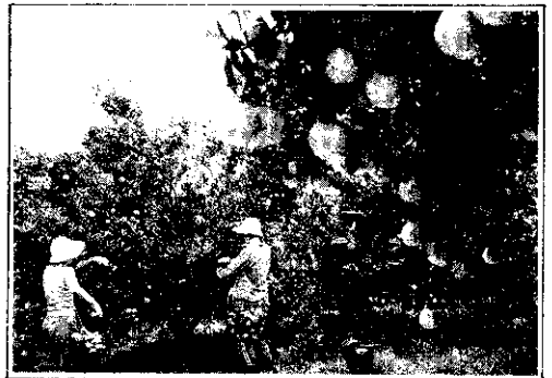
進口蘋果每公斤平均僅14.5元，拉低了省產水果的價格水準。