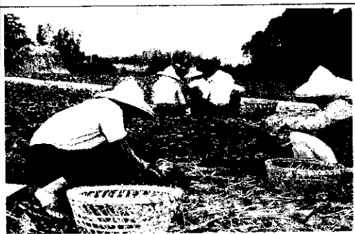
農民辛勤1~2個月所得的菜款，和零售商所賺的利潤差不多。

台灣地少人多，謀職不易，很多無一技之長的人就從事農產品零售的工作，且台灣的超級市場也在民國70年以後才開始較快發展，目前80%以上的生鮮農產品都在傳統式的零售市場（亦即俗稱的菜市場）、巷口或路邊的攤位零售。由於零售商的數目太多，以