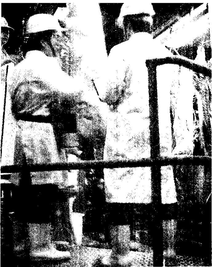
國內每年約消費800萬頭毛豬，但在電宰場屠宰的不到200萬頭。