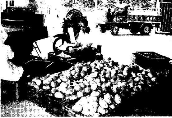
愛文芒果保價運銷前，先進行分級包裝工作。