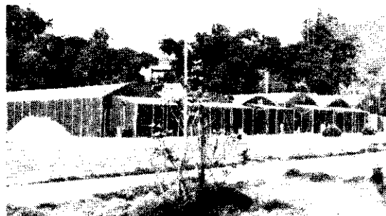
(台灣省農業試驗所菇類研究室)