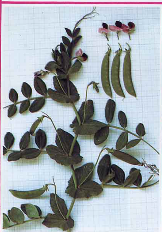
台中12號之植株形態

豌豆台中12號新品種主要抗白粉病，將來推廣後，可免噴藥防治，以節省生產成本及避免藥害或殘毒情形發生。此外，新品種生育強健，耐濕性強，栽培容易，產量高及冷凍品質優良，可增加農家收益，穩定本省豌豆外銷事業。