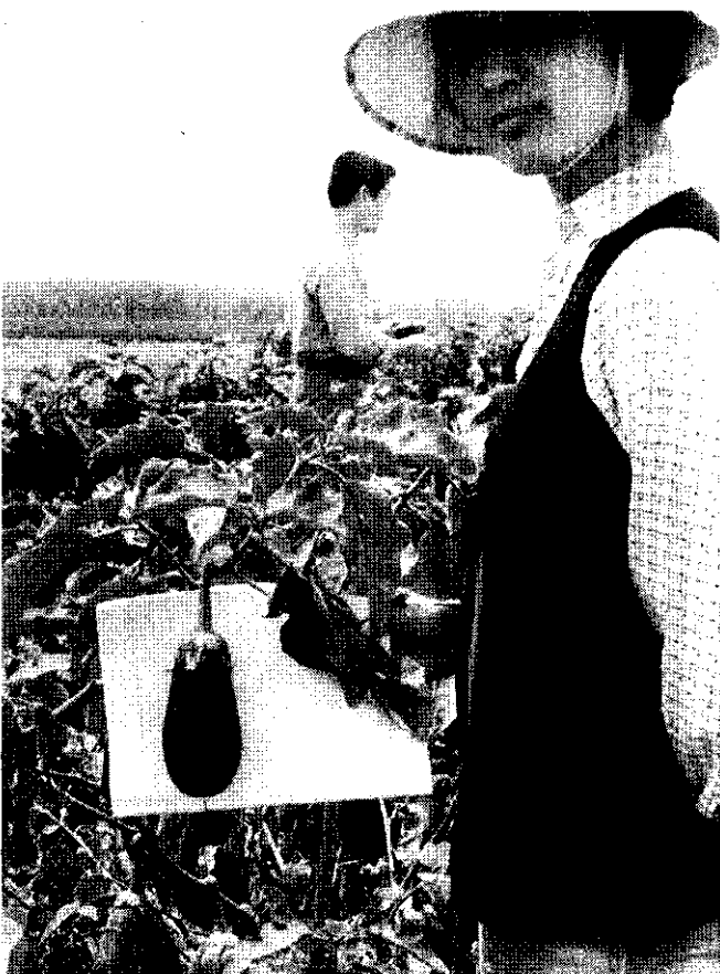
在即將採收的菜園裡進行農藥殘留採樣檢驗，有助於用藥安全之推動。

即將採收的蔬菜，其中農藥的殘留量到底有多少？未接受檢驗前，是未知數，誰也不敢確定。目前全省共有19位蔬菜殘留量測定員分駐各區農業改良場，專司抽驗工作，他們不辭辛勞地奔馳於各蔬菜栽培區，對即將採收的蔬菜進行採樣檢驗，並調查用藥情形，若有超量現象，他們會盡速通知你延期幾天採收。這種工作是為農友，也是為了消費大眾的安全，因此，有賴菜農充分配合，切勿把它當做是找麻煩。除此之外，在全省比較大的果菜市場也設有類似的檢驗站，負責抽測上市的果菜，現在的消費形態與以前大有不同，提高安全性是勢在必行，希望農友應有此種認知和共識。