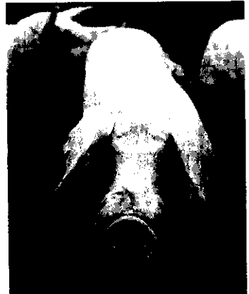
封面：養豬業再出發