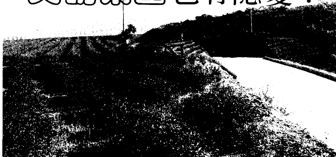
景緻優美的天鶴茶園風光

隨着工商業的蓬勃發展，社會結構改變，農村也受到刺激，使傳統的農業經營方式，由精緻農業取而代之。而精緻農業的發展，有些地區很成功，有些地區成功中也有潛在的困難。花蓮縣瑞穗鄉舞鶴台地的天鶴茶產區就是其中一個例子。