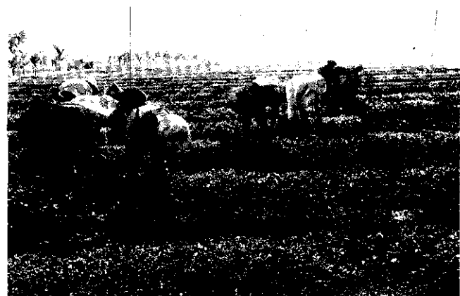
摘茶片片辛苦有誰知？