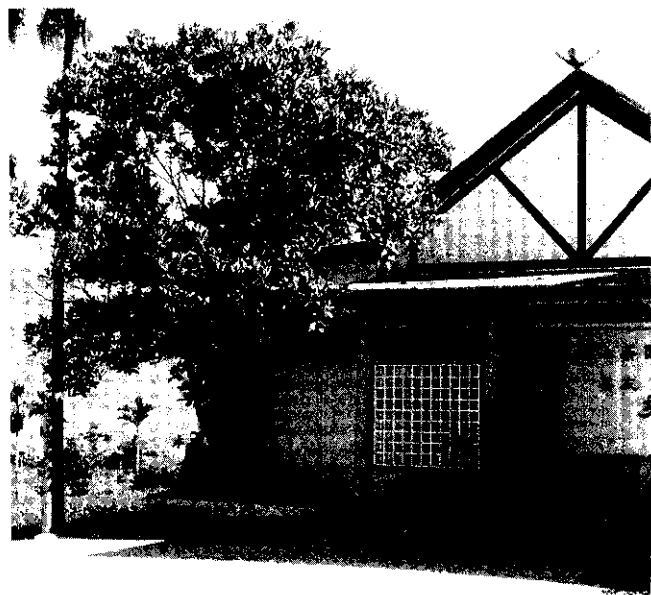
天鶴茶區採多元經營方式

在這種情形之下，天鶴茶的銷路只侷限於東部地區，銷路受限，價格連帶也不能提高，茶農的收益則限於一定的範圍之內，無法突破。