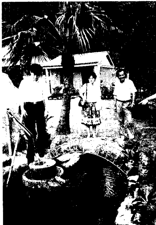
小橋、流水、人家，像這樣的居家環境，你心動嗎？