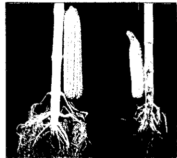
施用強根強壯素根旺有力尾