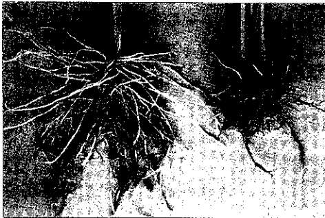
施用強根強壯素根旺有力尾

這是以前的天力補 100號強根素 306號強壯素 305號磷素 } 最理想的混合物