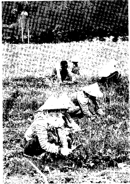
花生採收費工，尤其春豆採收時，恰逢雨季，倍感吃力，若能以機械採收，即能省時省工。(洪秀鳳)