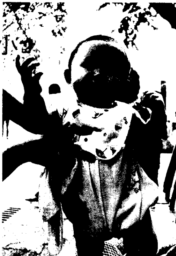
母親的手，愛心的手

迷你開腹法以局部麻醉在門診施行，副作用為0~6.5%，失敗率為0.2~0.6%，但肥胖婦女也較難