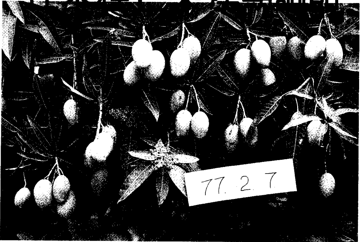
2月初果實陸續成熟