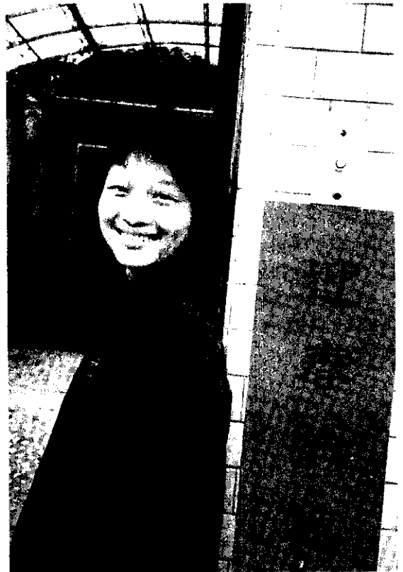
美齒小姐