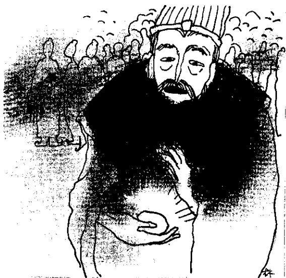
秦穆公接過玉璞一看，色澤翠潤。瑩光四射。