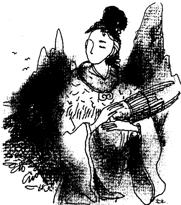
弄玉姿容無雙，聰穎絕頂，她常一人操笛吹簫。