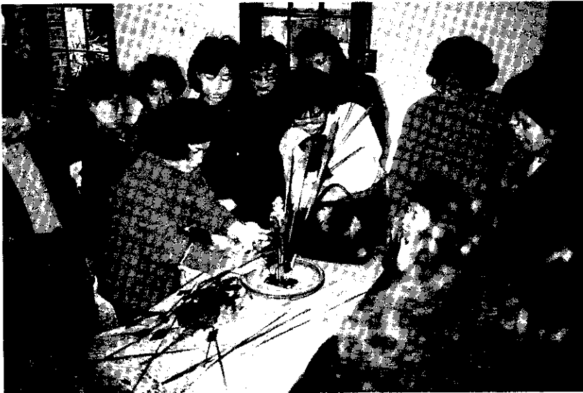
龜山鄉農會插花研習

五股 鄉農會於5月1日舉辦四健會花卉作業組觀摩活動，前往陽明山探索自然的奧秘，參觀士林玫瑰花推廣中心與陽明山山仔后花卉推廣中心。(許仁科)