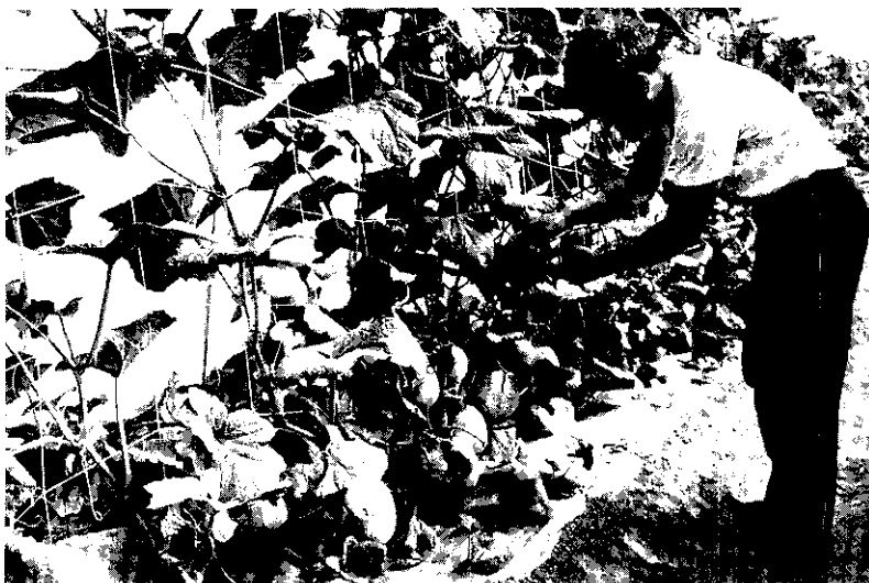
溪口鄉農會溫室洋香瓜開始採收

溪口 鄉溫室洋香瓜「天蜜」栽培成功，6月中旬開始採收，甜度15%以上，風味佳，口感好，汁水特別多，果皮網紋更是好看，歡迎各界人士前來參觀批售。