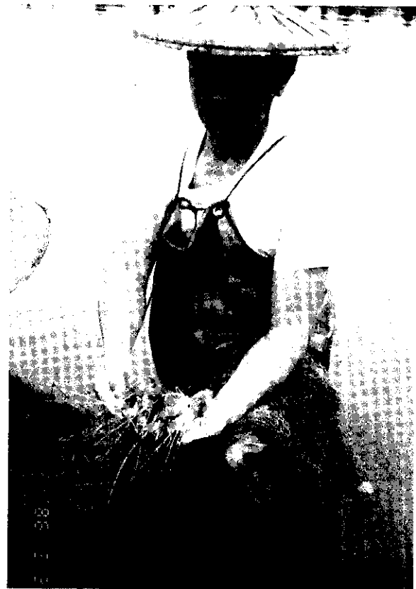
養殖業為我國賺不少外匯。(鍾玉峰)