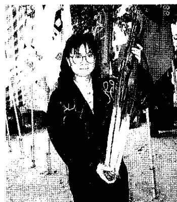
封面：豐原大葱

P.O. BOX 29 Taipei, Taiwan Republic of China