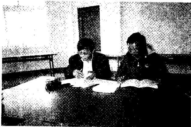
漁會與漁民簽訂契約