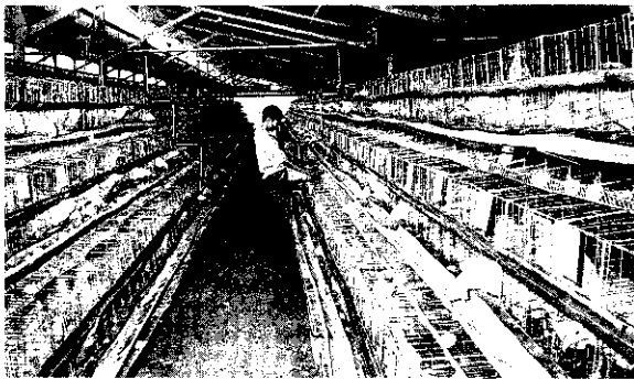
飲水不潔可能造成生產率低下等問題