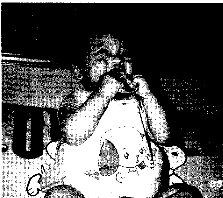
健康可愛的娃娃

用手指探入陰道內，也可以確定這條線是否存在，而知道IUD有否脫落或下滑。不過，樂普較易脫離原來的位置。