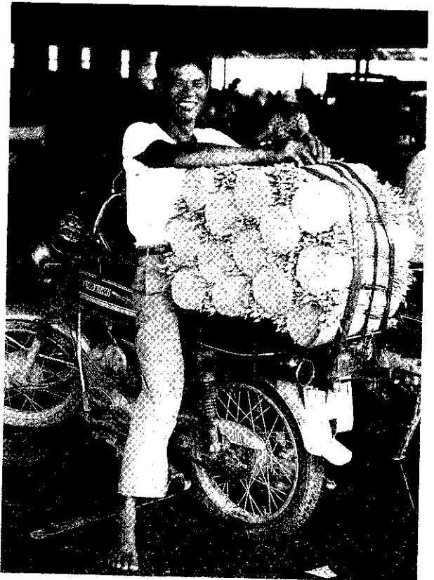
待價而沽的萼菜花

批發市場供應農產品，承銷人進場承購，以拍賣、議價、標價、投標等方式為之（第3條、第25條），批發市場並得分向供應人及承銷人收取管理費（第27條）。此外，如供應人之農產品未分級包裝者，市場得代為之，費用在貨款內扣還（第26條）。如果市場提供分級、包裝、整理、冷藏、冷凍、製冰、倉儲、搬運、電宰及其他有關設備者，亦得收取費用（第28條）。