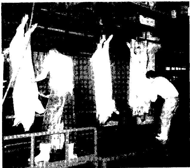
省產豬肉味道鮮美

所以，批發市場只是提供交易場地、設備、服務人員，為供應人及承銷人服務之機構，本身並不負交易之盈虧責任。實務上如輔導批發市場兼營包裝配送業務，成為直接運銷之一環，似亦為可資研究者。