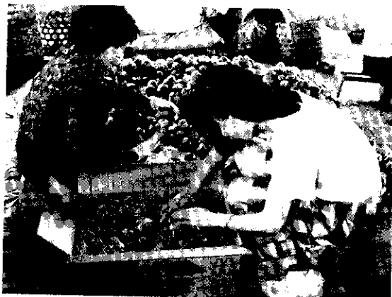
蓮霧裝箱運銷

，每株在幹基四周施尿素3~5公斤（視樹齡、樹勢、土質而異）或濃豬糞尿（不稀釋），使產生適度肥傷，經5~7天後，再催花。常可提高催花效果，但僅適用於樹勢旺盛之樹。