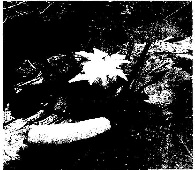
做為鮮瓜用的金線瓜，種植期55天即可採收。