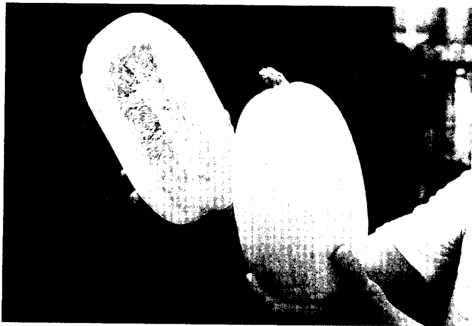
金線瓜及其縱切面(阿郎)