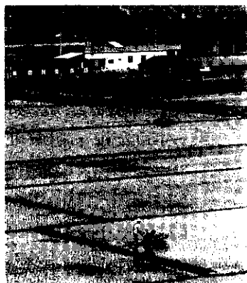
封面：插秧季節

P.O. BOX 29 Taipei, Taiwan Republic of China