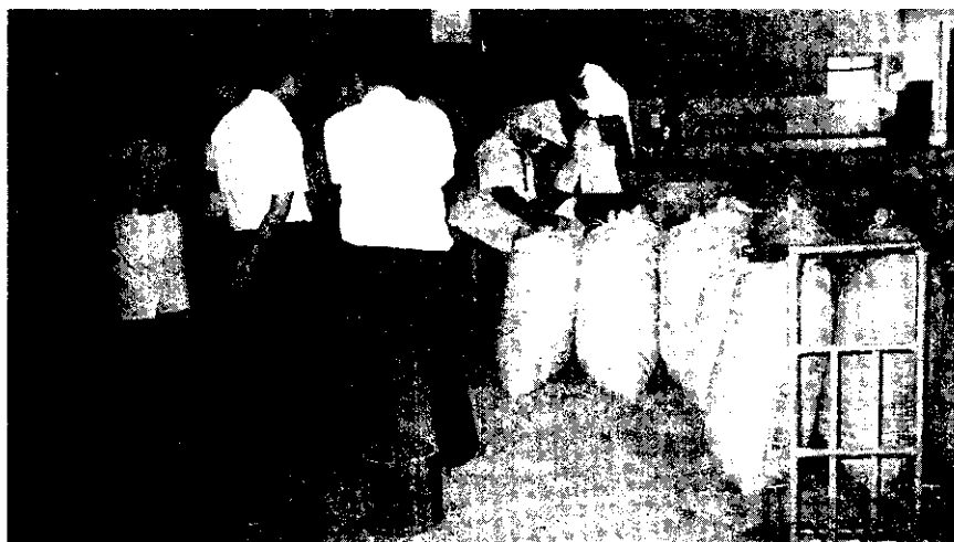
生產無黃麴毒素污染的花生仁工廠作業現況