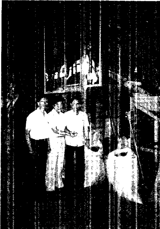
色彩選別機可剔除受黃麴毒素污染的花生仁

虎尾鎮位居雲林縣中心，總面積68,742平方公里，其中耕地面積為 5,132公頃，總人口數67,153，農業人口數28,156。主要生產的農作物有稻米、花生、大蒜、甘蔗及蘆筍等。