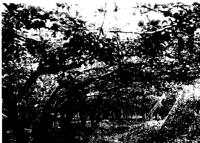
每公頃冬梨收益高達一百萬元

三灣冬梨的栽植是採用插枝與播種兩種，在育苗圃裏栽種烏梨，1年後接橫山梨的枝幹，再隔1年以每株間隔25~30公分的距離種植在山坡地上，坡度以10~20度為宜，超過30度應設階層，以利水土保持。