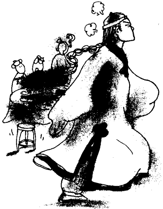
龍姑爺非常不悅，掉頭就走，從此便不再回陸家。