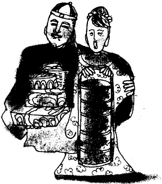
第二年春節，龍姑爺夫婦帶著珍貴的禮物向岳父母拜年。