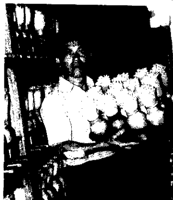
封面：戴德隆培養金菇菌種

P.O. BOX 29 Taipei, Taiwan Republic of China