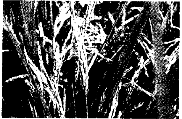
稻細菌性谷枯病病徵