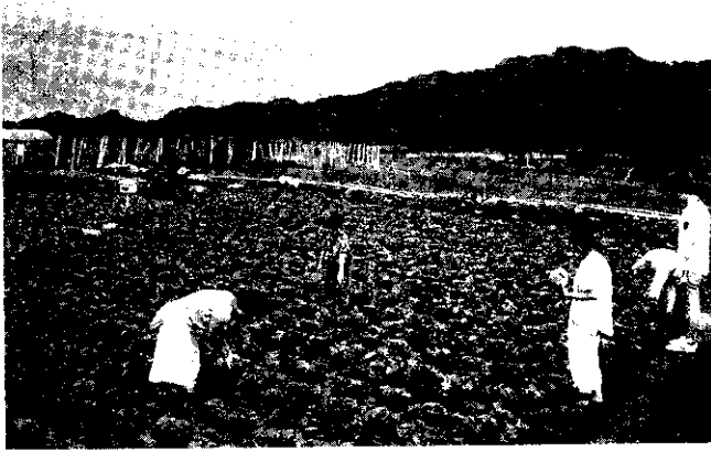
甘藍園防治紋白蝶噴施本藥劑，不會污染環境。