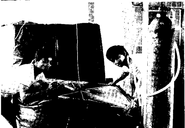
利用塑膠袋內充二氧化碳脫澁

的方法是在果樹基幹上實行環切，以促進果實成熟及幼齡樹的花芽分化。採用這種方法，能使生理落果降到10%以內，大幅提高柿子單位面積產量。最近也發展以噴洒生長激素的方法，來改善使用環切可能引起的缺點。因為適當的水份及養份是生產優良水柿果品的重要條件之一。目前還計畫推廣以果園覆蓋，並實施老弱果樹枝幹疏伐整枝工作，使得果樹之枝葉都能得到充分的日照。而在植株下方栽培覆蓋植物，一方面供作綠肥使用，另一方面發揮涵養水份，使乾旱季節保持果園適當之濕潤及水土保持之功用。