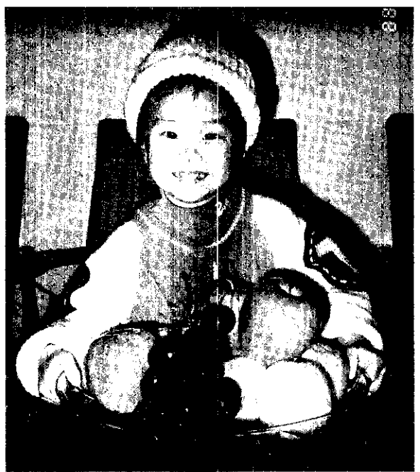
可愛的孩子

家庭習俗的重要不僅在有那些事情已做了，且在於家人分享經驗及感覺，從這些年年重覆的家庭習俗或慣例的活動，更可領會到家的重要性。