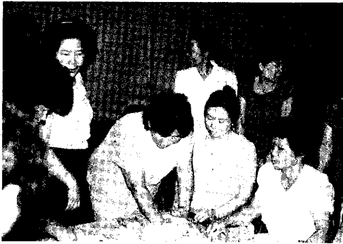
家政班員點心製作講習