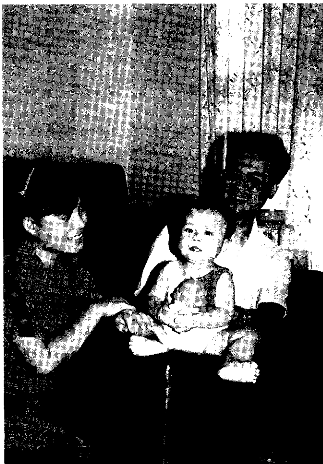
豐富孩子的童年，父母要十分努力。

極進取的態度，也比較會「斤斤計較」。以生兒育女而言，「由命不由人」的人已不多，要不要生，生幾個可以加以控制，連什麼時候生