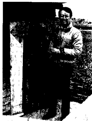
封面：芹菜香香香

HARVEST Farm Magazine P.O. BOX 29 Taipei, Taiwan Republic of China