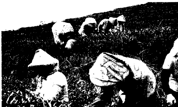
茶業經營面臨困難，連採茶工資都難以支付。