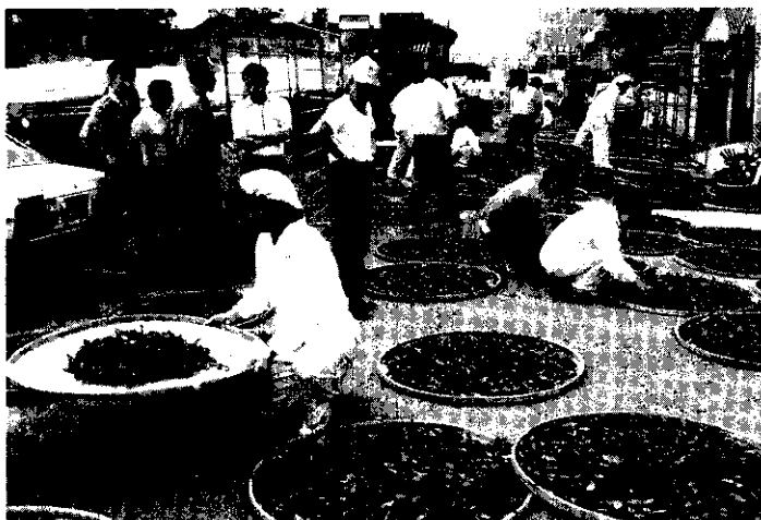
經常舉辦製茶比賽，僅侷限部份茶業，無法有效發揮效果。

的價值不夠支付工資，因此很多茶樹的黃柑種，甚至是青心大冇的茶園，都已任其荒蕪，雜草叢生。