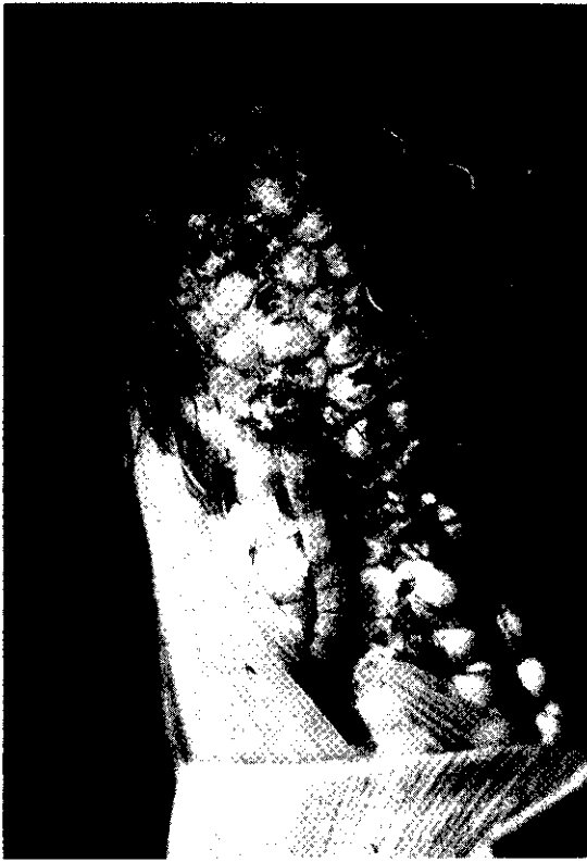
玉米穗虫爲害情形