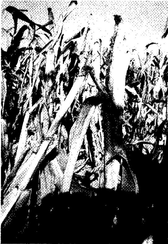
若防治不當，玉米後期為螟虫為害，以致無法收穫。

為消除消費大眾的疑慮，於超甜玉米生育期間，應釋放寄生蜂，再配合使用蘇力菌，拔除雄花及在生育初期施用低毒性農藥，可對玉米螟及一般性害虫