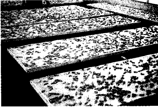
平板式平面菌生產情形