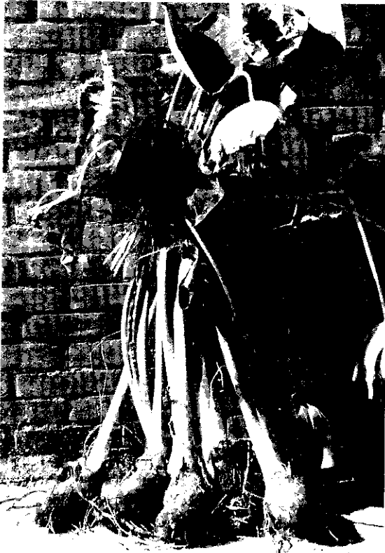
芋莖及芋頭均可食用，味道極為鮮美。

今年公館鄉共種植有 150餘公頃的檳榔心芋，由於氣候、雨量及土壤適宜，品質相當不錯，可烹飪煮食，色香味俱佳外，還可以做成芋頭糕，以及食品加工廠製成芋頭粉供做糖菓及餅乾之原料，消費者有口皆碑。