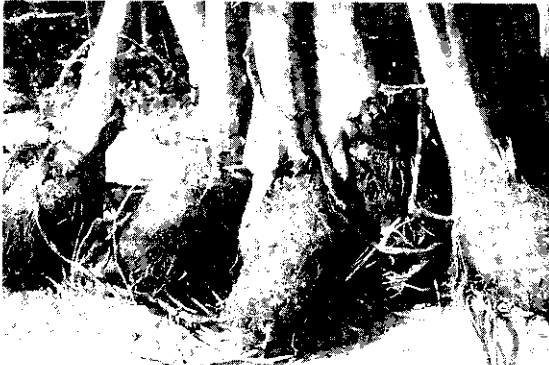
每個芋頭重約1~3台斤