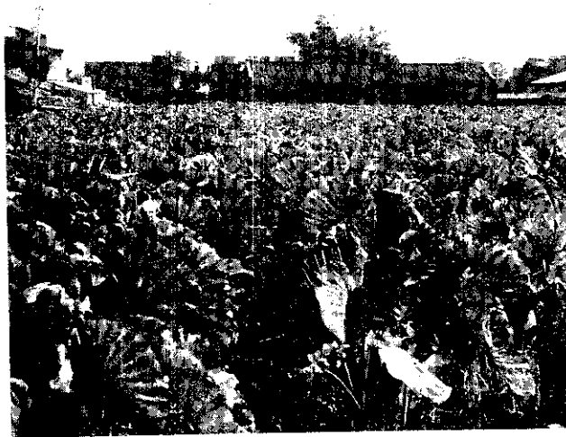
公館鄉福基一帶廣植檳榔心芋