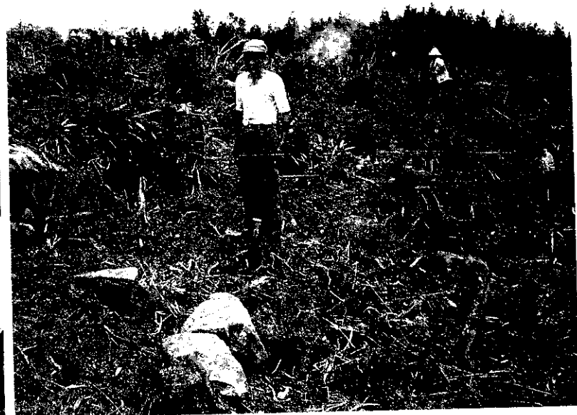
杉木砍伐後山胞忙著開墾情形