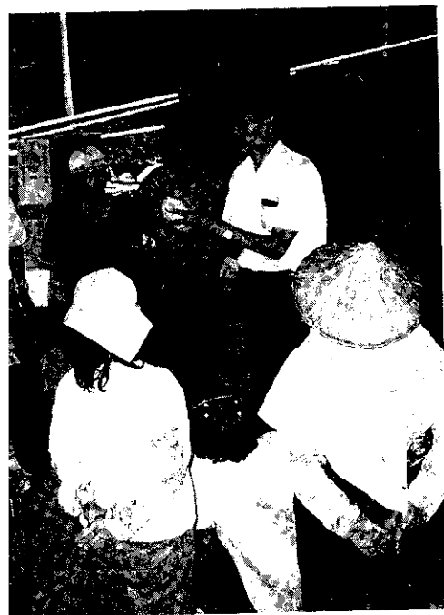
講解蘿蔔分級包裝

山胞們為了好好經營這塊處女地，也將整個精神投入，從清晨上山後，即在現場搭起帳棚和炊具，頂著艷陽工作，中午休息片刻，又繼續努力工作，才有今天的豐收，每位山胞臉上，都按捺不住一絲興奮和希望。