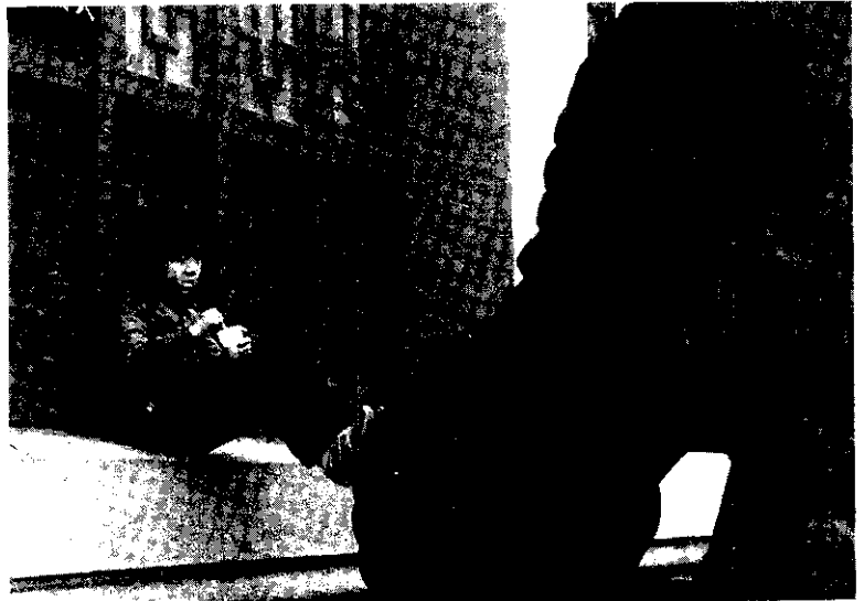
關心她，傾聽她的心聲。

由於出生率下降，有偶婦女生育數降低，計畫生育實行率極高，家計工作在量的方面顯然已有相當的成果，加上台灣地區人口自然增加率已降至原訂目標之下。未來家